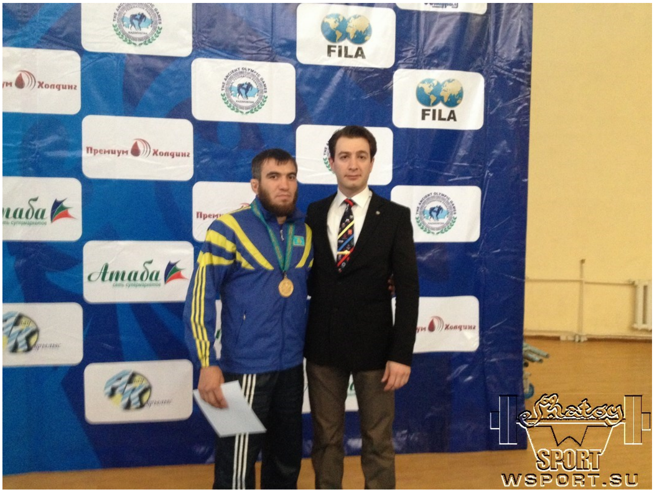
Айдамир и Салман Хамзатов - чемпион Азии 2014 (Pankration Submission)