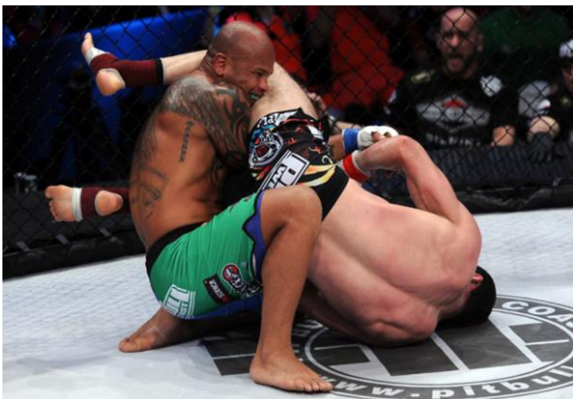
Мамед проводит болевой прием

Известный чеченский боец из Польши Мамед Халидов с 2010 года не знает поражений. И на этот раз он доказал, что не зря входит в ТОП-10 мирового рейтинга средневесов. Уже в конце первого раунда он заставил бразильца сдаться болевым приемом на руку.