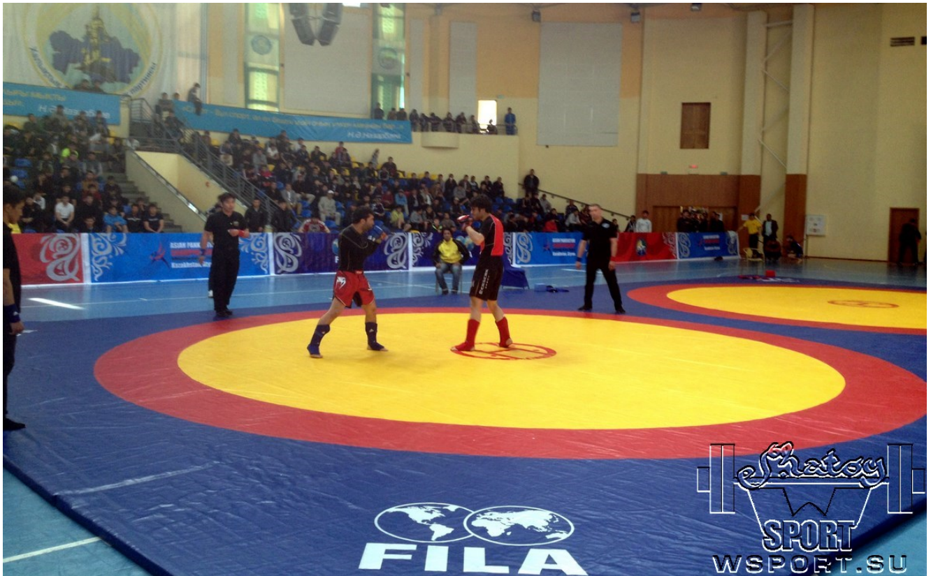
1-й день Чемпионата - Pankration Submission.