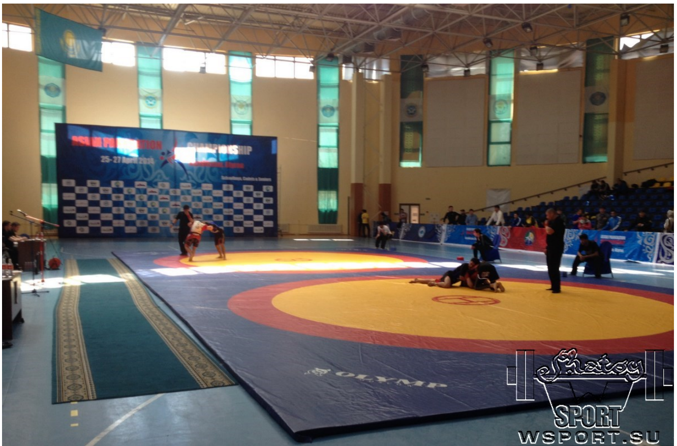
1-й день Чемпионата - Pankration Submission.