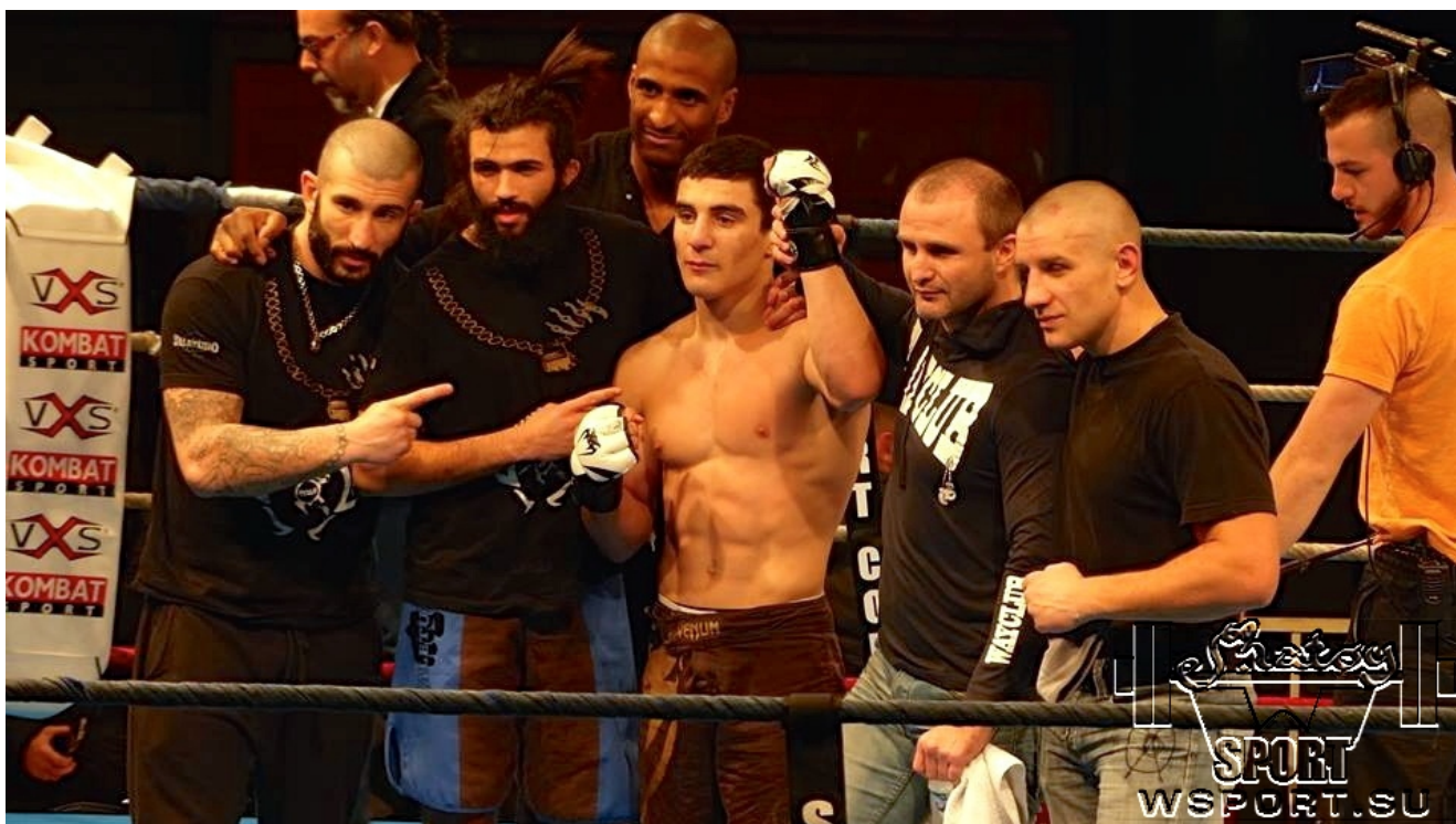
С командой Boxing Squad