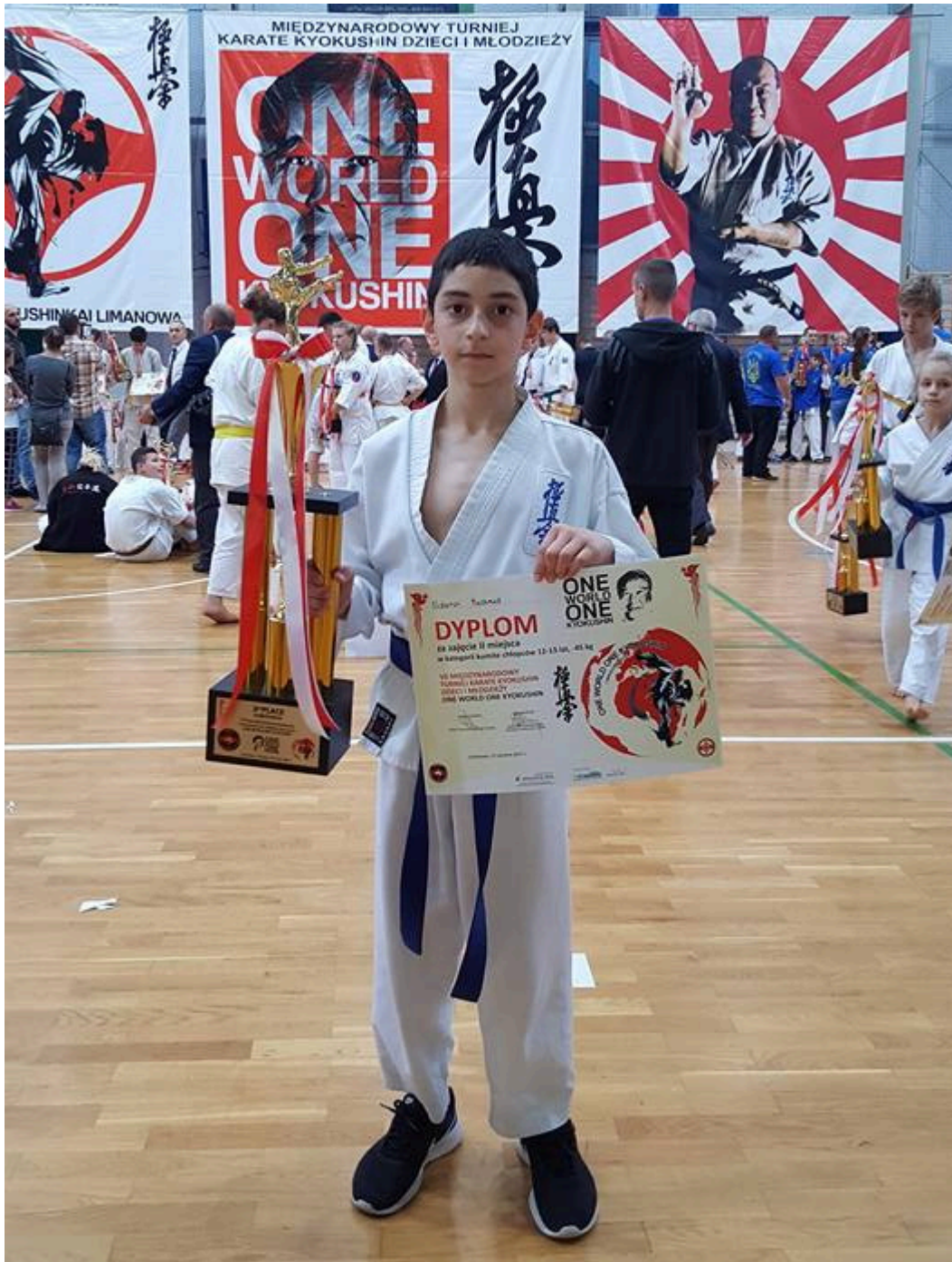
Бронзовый призер турнира в Польше Магомед Эльдаров