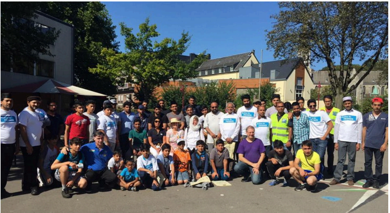
Борцы клуба "Сайтиев" также участвуют в разных общественных акциях