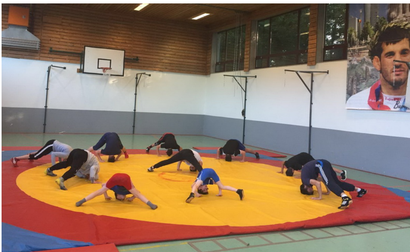
Спортсмены БК "Сайтиев" начали новый сезон 2016-2017