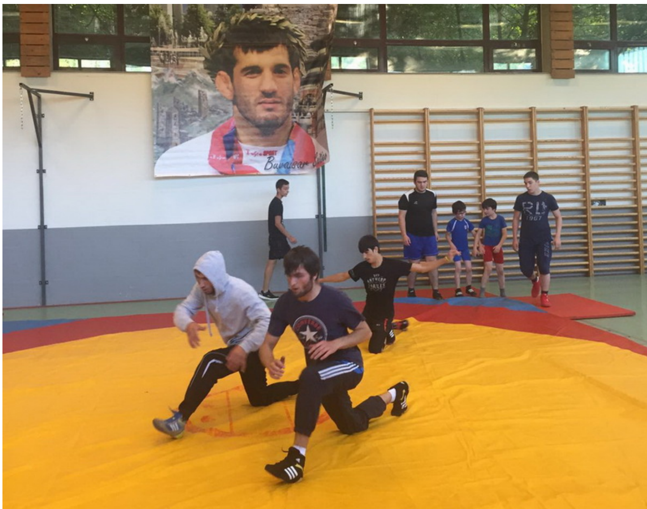
Спортсмены БК "Сайтиев" начали новый сезон 2016-2017