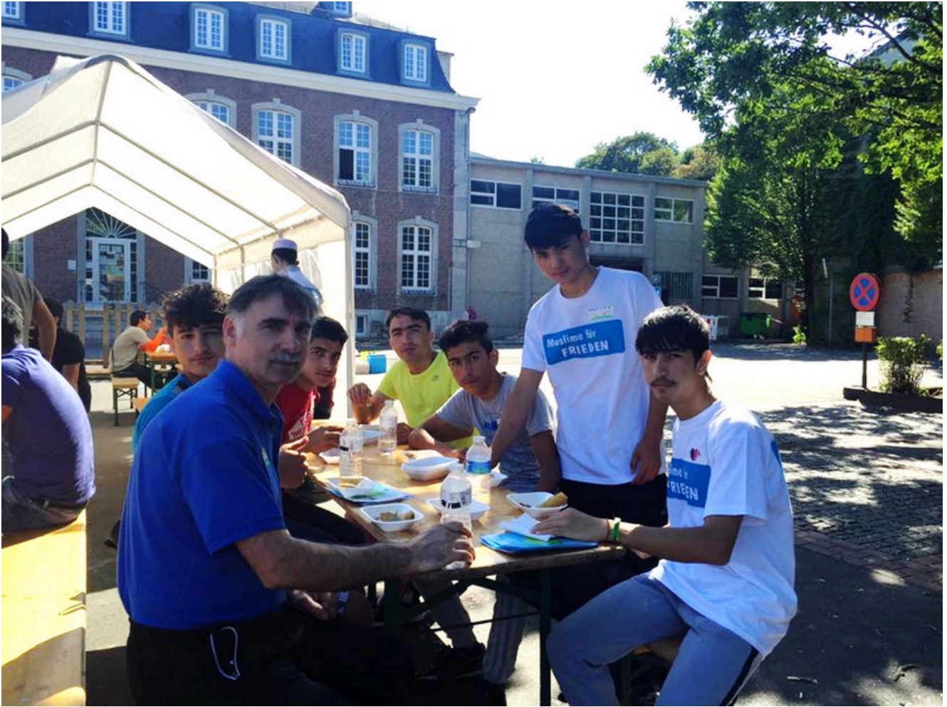
Борцы клуба "Сайтиев" также участвуют в разных общественных акциях