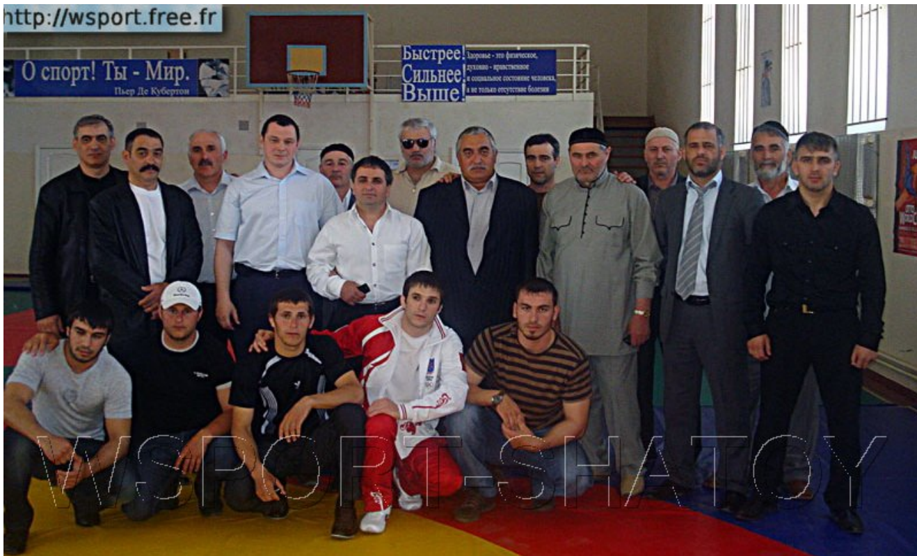
В завершение - фото на память.