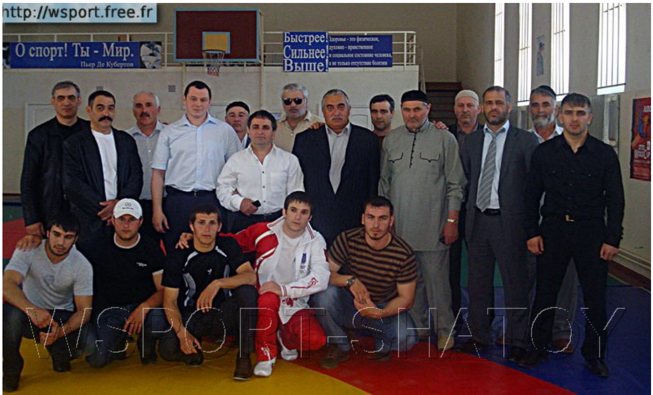
В завершение - фото на память.