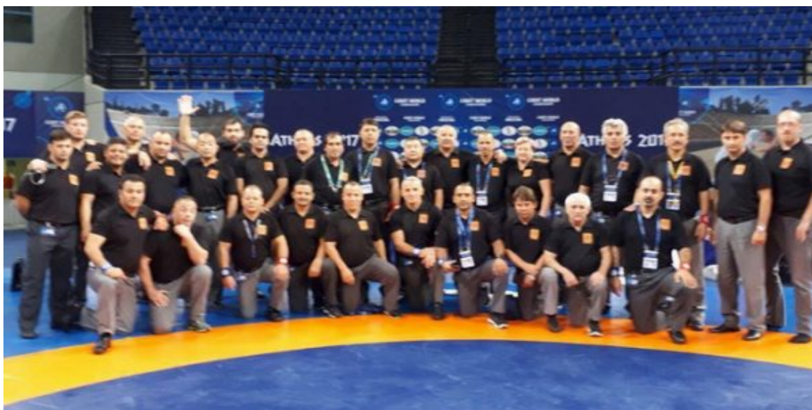
Судейская команда первенства мира