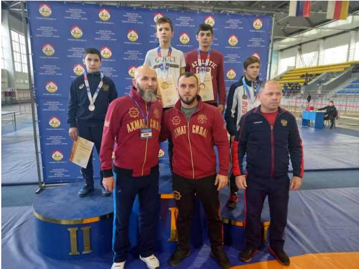
Награждение призеров весовой категории 48 кг.