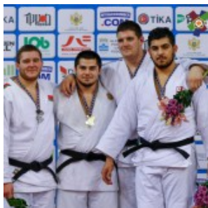
Чемпион Европы-2017 до 23 лет Тамерлан Башаев