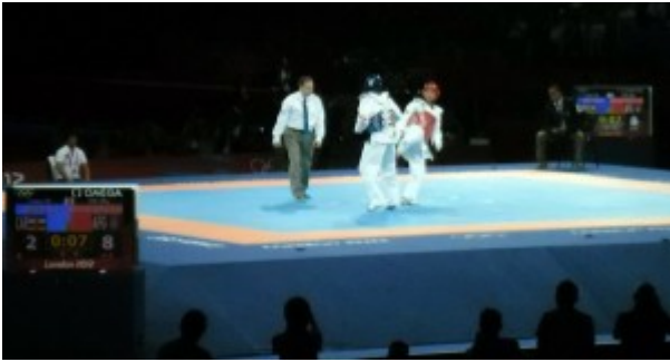
Соревнования по тхэквондо

Вместе с Апти Аухадовым я наблюдал соревнования по тяжелой атлетике среди мужчин в весовой категории 94 кг. Это были напряжённые и интересные состязания, где борьбу вели тяжёлоатлеты из Казахстана, России, Молдовы и Ирана. Но скажу, что среди них выделялся Илья Ильин из Казахстана.