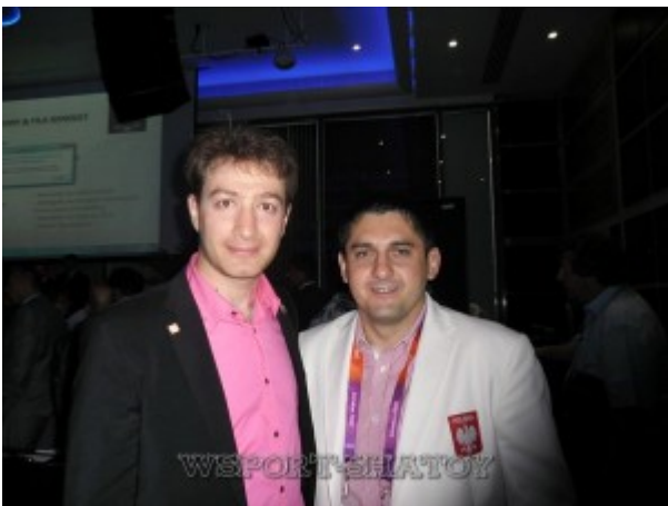
Айдамир и президент Федерации борьбы Польши Крыштов Клозек