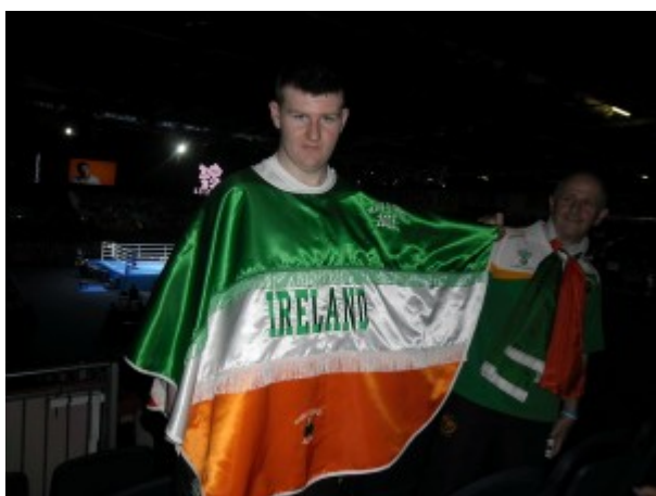
Ирландский болельщик бокса

Я заметил, что на всех соревнованиях в зале были пустые места, сто свободных мест бывало точно (специально подсчитал). В то же время на улице перед EXCEL всегда стояли люди без билетов. В кассах билеты невозможно было купить, только через интернет, хотя и на сайте Олимпиады практически невозможно было приобрести билеты.