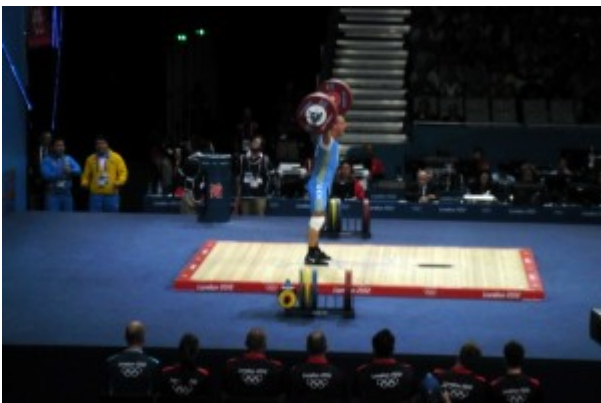
На помосте Илья Ильин

Вместе с Апти Аухадовым я наблюдал соревнования по тяжелой атлетике среди мужчин в весовой категории 94 кг. Это были напряжённые и интересные состязания, где борьбу вели тяжёлоатлеты из Казахстана, России, Молдовы и Ирана. Но скажу, что среди них выделялся Илья Ильин из Казахстана.