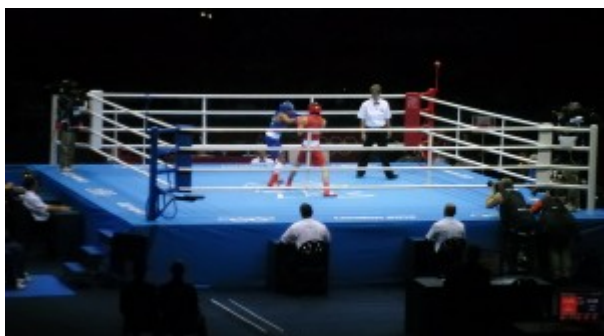
Соревнования по боксу

Когда выдавалось немного свободного времени, смотрел соревнования по другим видам спорта, которые проходили в зале EXCEL – настольный теннис, бокс, тхэквандо и, конечно, тяжелая атлетика.