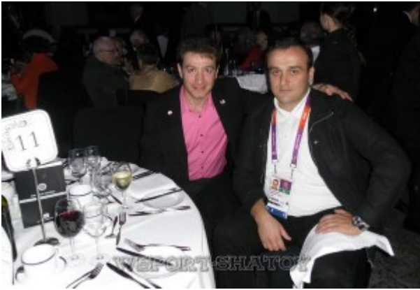
Айдамир и президент Федерации борьбы Грузии Каха Гецадзе