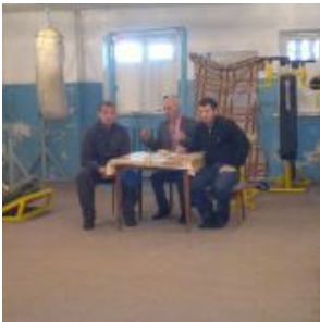
Так выглядели тренировочные залы в Чечне на рубеже XXI века