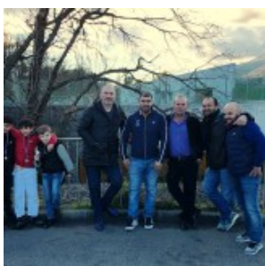
Группа поддержки из родителей