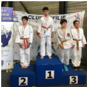
Чемпион Ансар Басханов