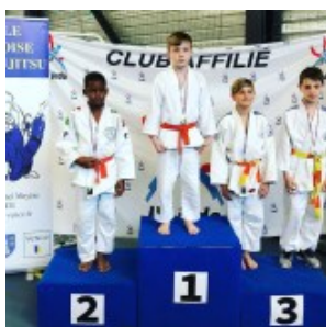
Чемпион Ахмад Табуев