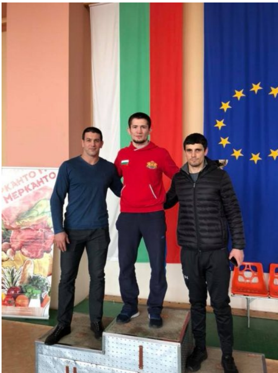
Чемпион Болгарии Али-Паша Умарпашаев