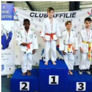
Чемпион Ахмад Табуев