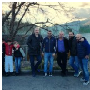
Группа поддержки из родителей