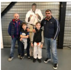
Давид Мчедлиани, Тимур Дзагиев и ученики с Тедди Ринером