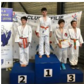
Чемпион Ансар Басханов