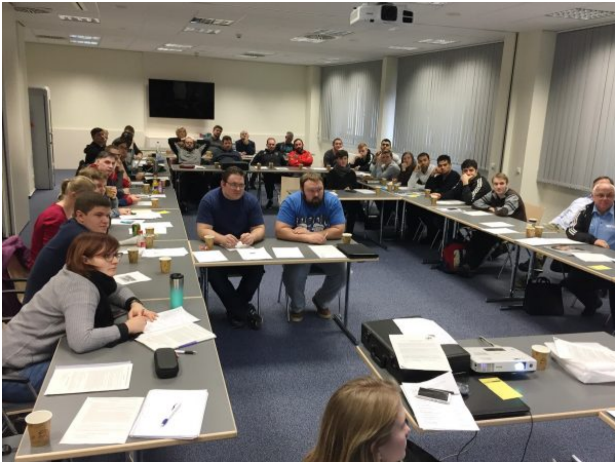
Судейский семинар в Хеннефе 5-7 января 2018г .