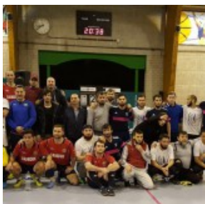
Участники Кубка Евровайнах-2017 по мини-футболу