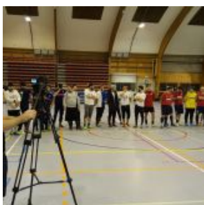
Участники Кубка Евровайнах-2017 по мини-футболу