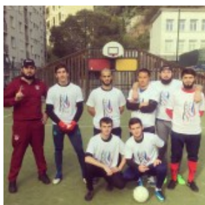
Команда Ниццы готовится к Кубку Евровайнах-2017