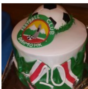
Клуб «Даймохк» из Москвы стал победителем Кубка Евровайнах-2017 в Бельгии