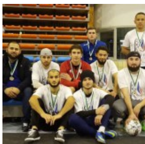
Футболисты из Ниццы в Бельгии на Кубке