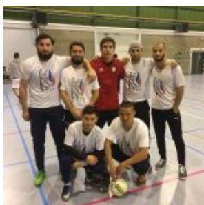
Футболисты из Ниццы в Бельгии на Кубке Евровайнах-2017 в Бельгии